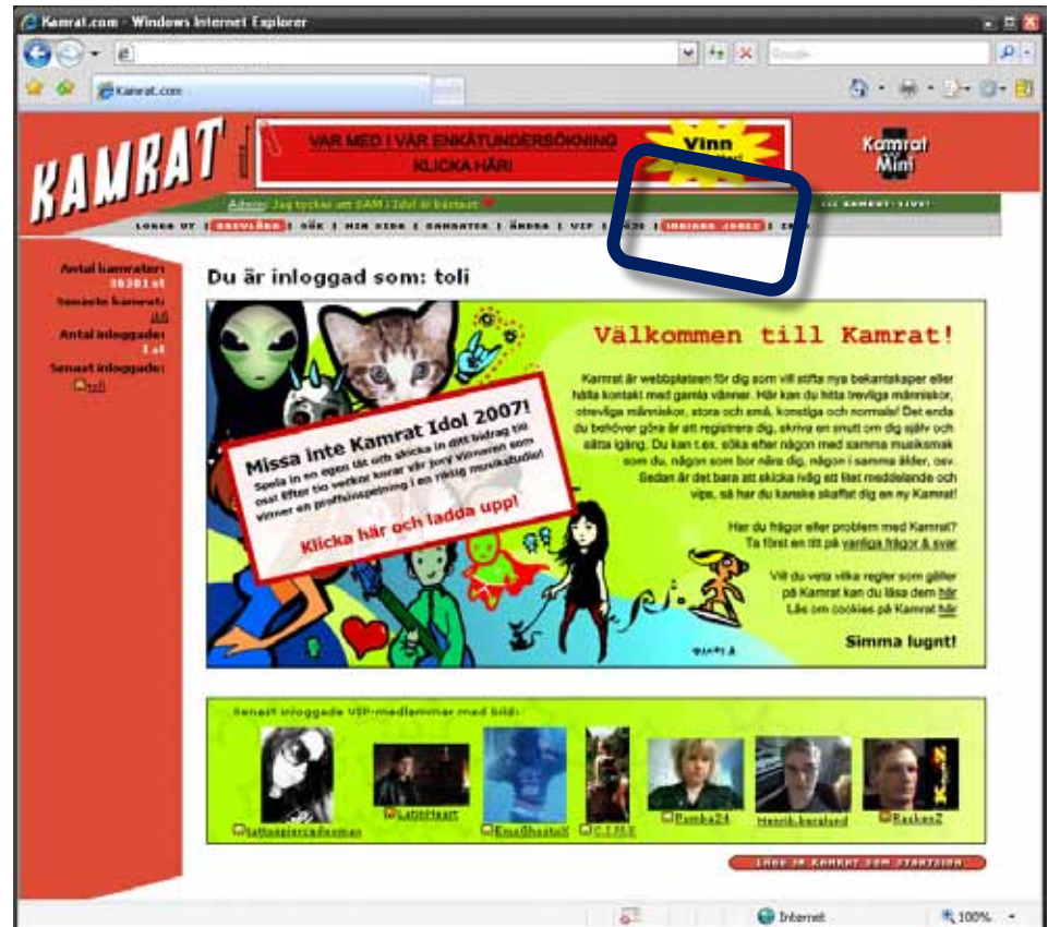
Kamrats förstasida med blinkande kampanjknapp. Se förstora bild på nästa sida.

Ø I stort sett samtliga Kamrats medlemmar som loggar in under kampanjtiden kommer att besöka kampanjsidan minst en gång. D.v.s undersidan får ca 60.000 unika besökare (unika medlemskonton) under en veckas kampanjtid!